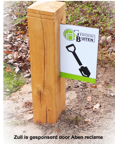
Zuil is gesponsord door Aben reclame

Deze unieke ontmoetingplek zal een plek worden waar verbondenheid het sleutelwoord zal zijn.